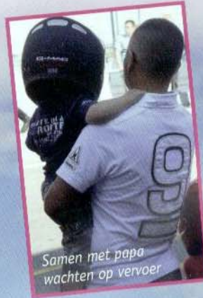
Samen met papa wachten op vervoer