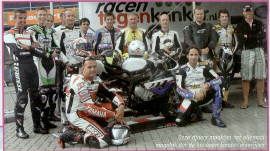
Deze rijders maakten het allemaal mogelijk dat de kinderen konden meerijden