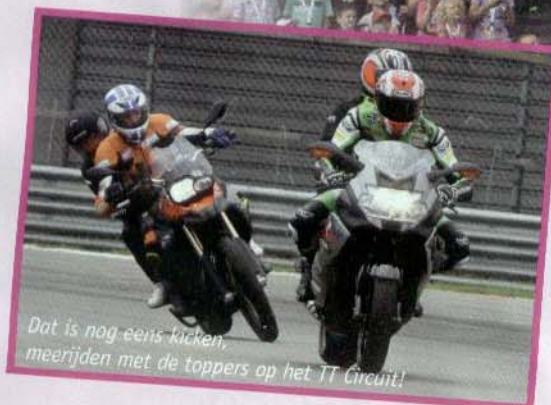
Dat is nog eens kicken, meerijden met de toppers op het TT Circuit!