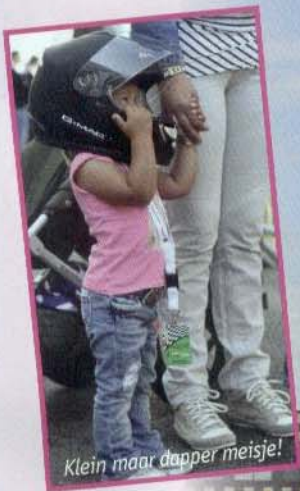
Klein maar dapper meisje!