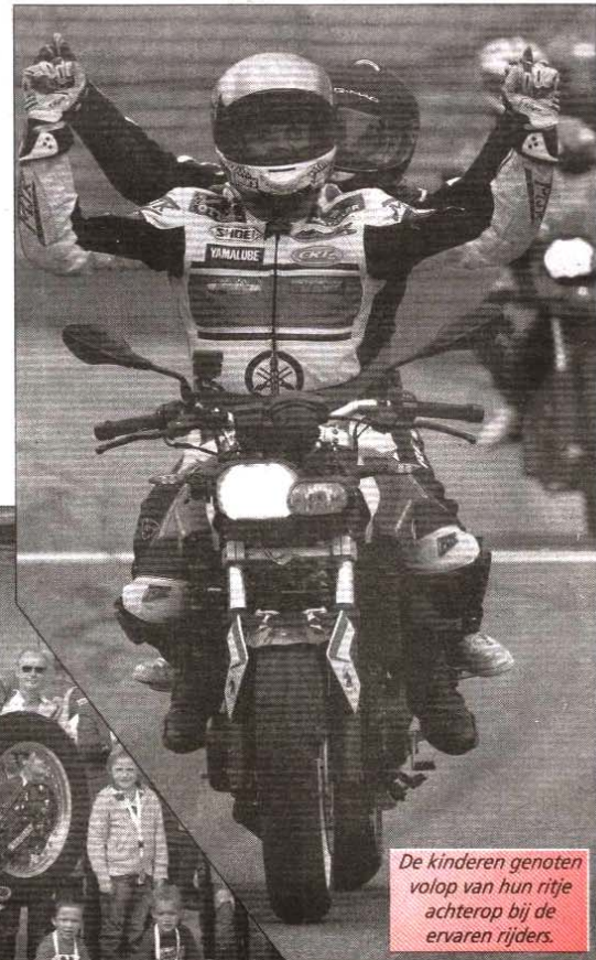
De kinderen genoten volop van hun ritje achterop bij de ervaren rijders.